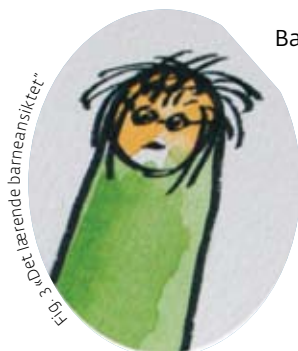
Fig. 3: «Det lærende barneansiktet»

Barnet kan også møte barnevernsarbeider med et lærende ansikt. En «ansikt» som etterspør opplæring, kunnskap og undervisning. Når barnevernet kommer inn i familien blir barnets livsbetingelser, gode som