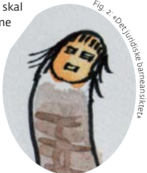
Fig. 2: «Det juridiske barneansiktet»

uttale seg før det tas avgjørelse i sak som berør ham eller henne. Denne retten gjelder fra fylte 7 år, men også yngre barn som er i stand til å danne seg egne synspunkter, skal gis anledning til å uttale seg. I samme paragraf står det at barnets mening skal tillegges vekt i samsvar med barnets alder og modenhet. De fleste vil nok være enig i at barnets mening i denne saken må tillegges svært liten vekt, å sikre barnet en trygg omsorgsbasis veier tyngst i denne avgjørelsen. Når det kommer til valg av fosterforeldre, kan kanskje barnets mening tillegges mer vekt. La oss si flere tanter og onkler er aktuelle som fosterforeldre, og at barnevernet vurderer alle som like godt egnet. Da mener jeg det er aktuelt å la barnets mening veie tungt. Faren er at barnet kan bli sittende igjen med skyldfølelse over å ha «vraket» de andre tantene og onklene. Det juridiske barneansiktet sitter på tommelen som vi griper med. Her finner vi barnet som har rett på å få informasjon og bli hørt (jf. lov om barneverntjenester § 6-3 og artikkel 12 i FN-konvensjonen om barns rettigheter) før barnevernet griper inn. Den faglige oppgaven i barnesamtalen i eksemplet ovenfor kunne være å gi barnet informasjon om mors psykiske sykdom og konkretisere for barnet hvorfor det ikke kan bo hjemme, og lytte til og ta hensyn til barnets ønsker i valg av slektsfosterhjem.